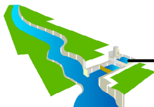
Captação 2 Q = 8,3 l/s